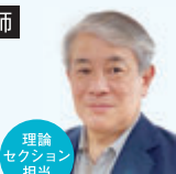
理論セクション担当